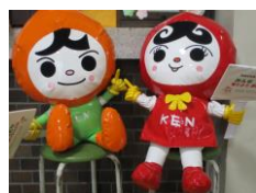
人KENまもるくん 人KENあゆみちゃん

先日、児童朝礼で人権主担者より「人権」について児童にお話ししました。二小に通う児童や先生方すべての人が「安全」に「安心」して「自分らしく」過ごすことができ、毎日を笑顔で過ごせるような学校をみんなでつくっていきましょう、という内容のお話でした。子どもたちの思いや個性を大切にしながら、いいところをたくさん伸ばしていけるよう、職員も人権意識を高くもつように努め、学校でのさまざまな場面での言葉かけを行っていきます。